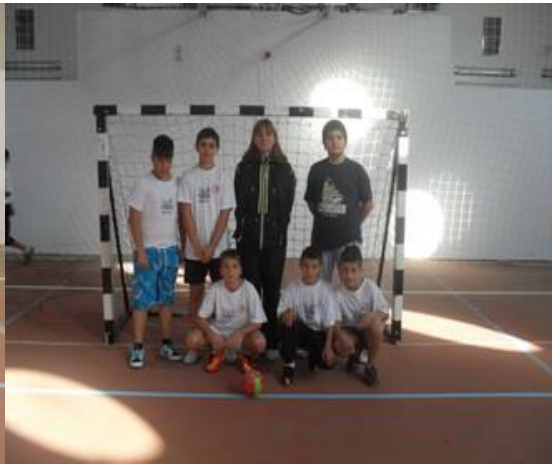
о.ш. Вук Караџић - Бор