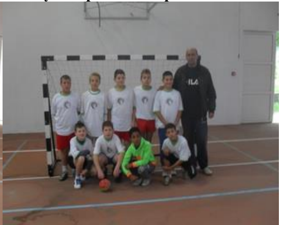
о.ш. Свети Сава - Бор