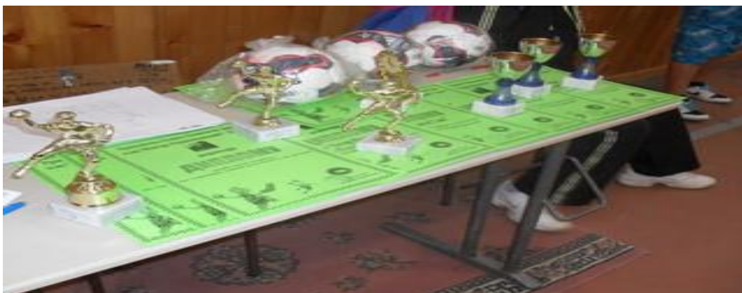
Рукометни савез општине Бор се побринуо за награде