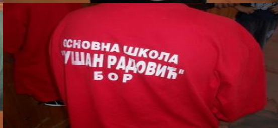
Похвала руководиоцима школа на једнообразност опреме