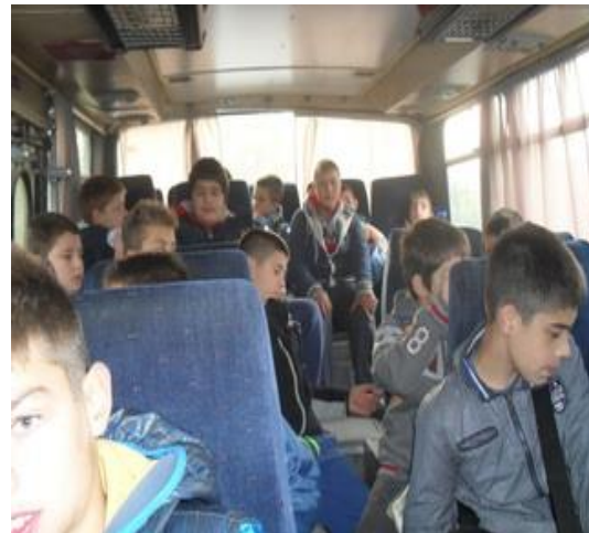
У ишчекивању превоза за Злот и атмосфера у аутобусу