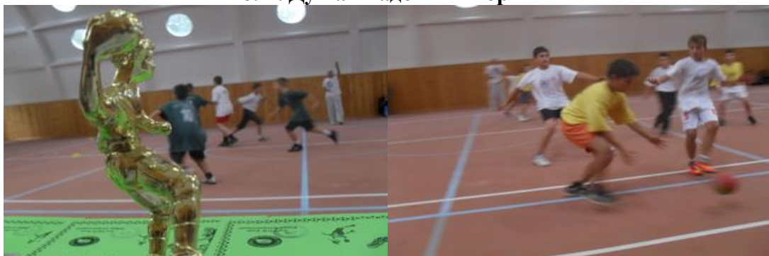
деталји са турнира