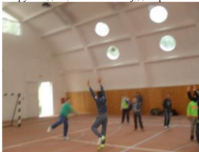
Детаљ по завршетку турнира, дечаци који нису учествовали, највећег села општине Бор, узели су рукометну лопту

Билтен издаје РС ОПШТИНЕ БОР.09.10.2014-г.