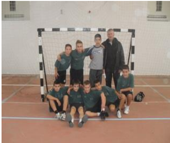
о.ш. 3 октобар - Бор