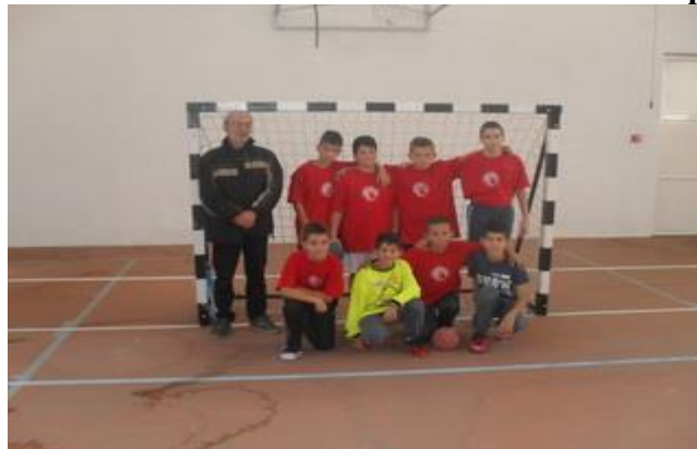
о.ш. Душан Радовић - Бор