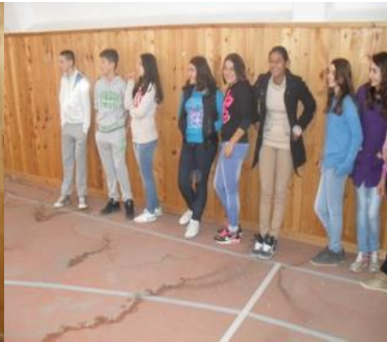
Било је и публике као и на свим школским турнирима