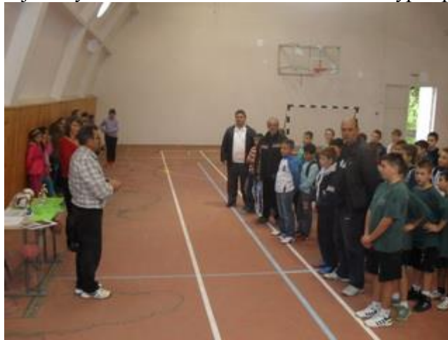
Завршница и проглашење победника и најбоњих