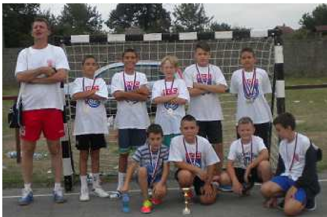
РУ РАДНИЧКИ 1964 из КРАГУЈЕВЦА ТРЕЋЕПЛАСИРАНА ЕКИПА код ДЕЧАКА