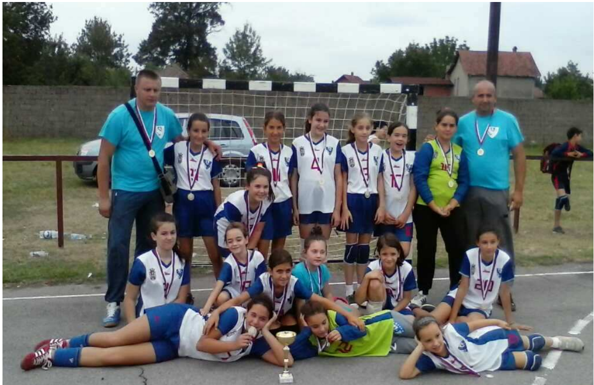
ЖРК УМЧАРИ из УМЧАРА ПРВОПЛАСИРАНА ЕКИПА код ДЕВОЈЧИЦА