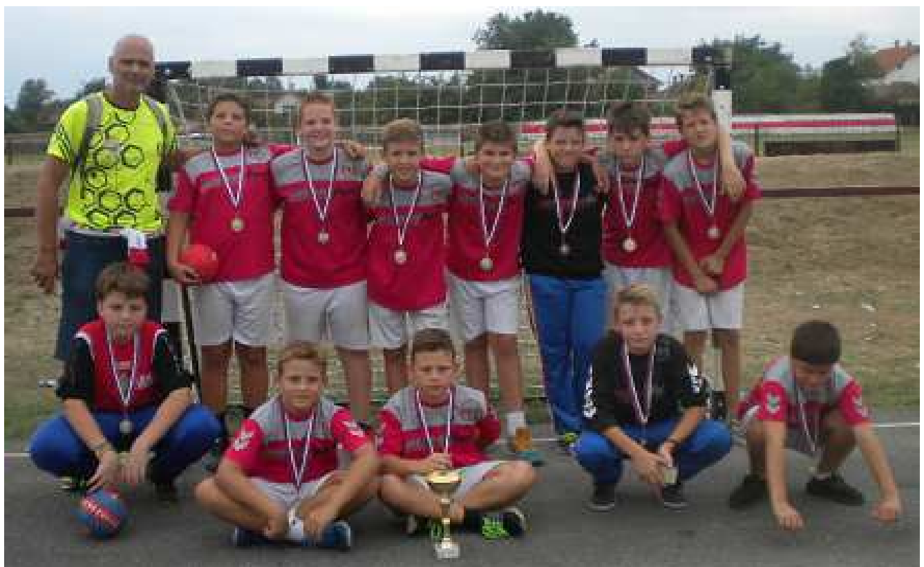
РК ПАЛАНКА из СМЕДЕРЕВСКЕ ПАЛАНКЕ ПРВОПЛАСИРАНА ЕКИПА код ДЕЧАКА