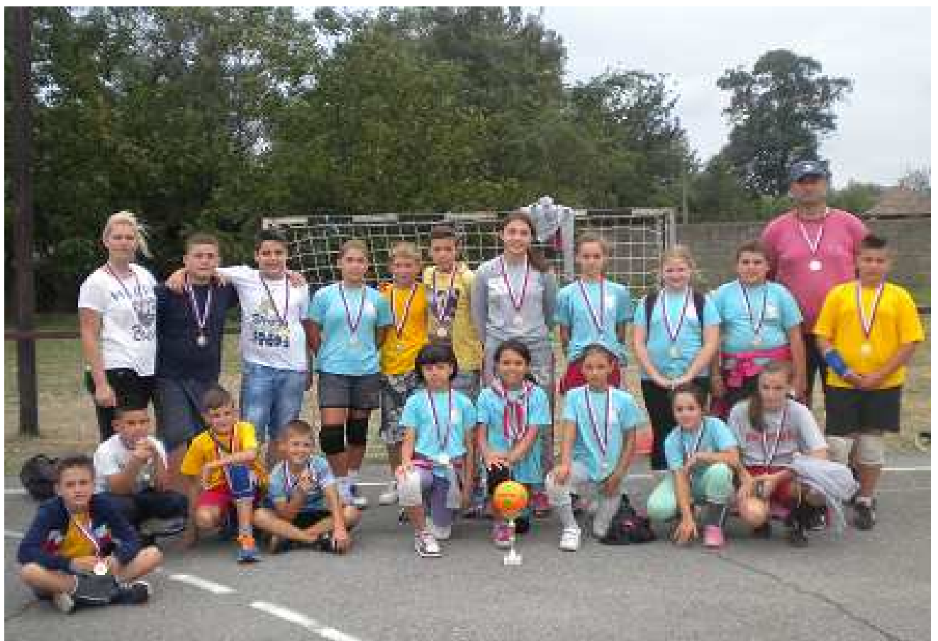
ЖРК МОРАВА из ВЛАДИЧИНОГ ХАНА ДРУГОПЛАСИРАНА ЕКИПА код ДЕВОЈЧИЦА