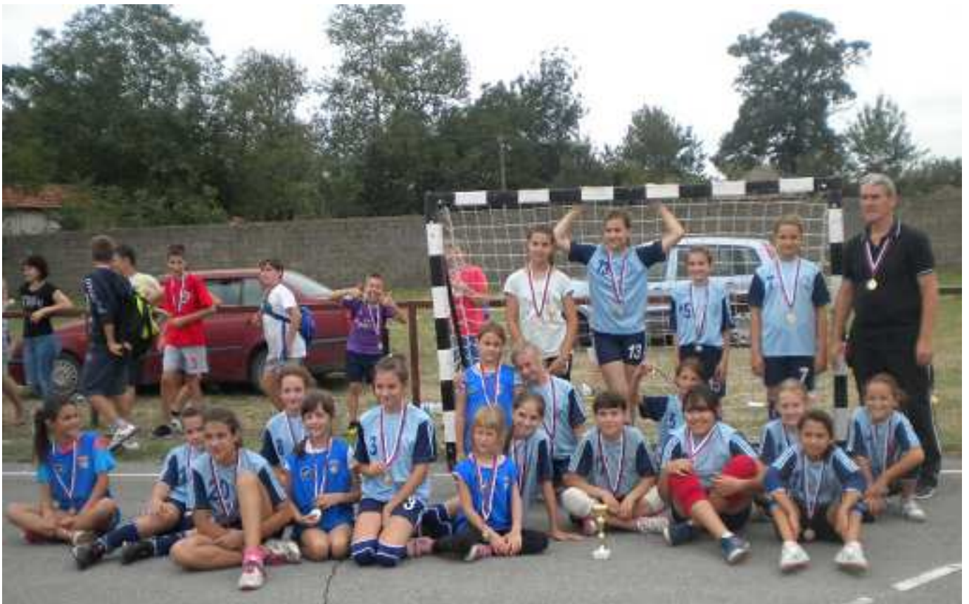
ЖРК УДАРНИК 1 из ЛОЗОВИКА ТРЕЋЕПЛАСИРАНА ЕКИПА код ДЕВОЈЦИЦА