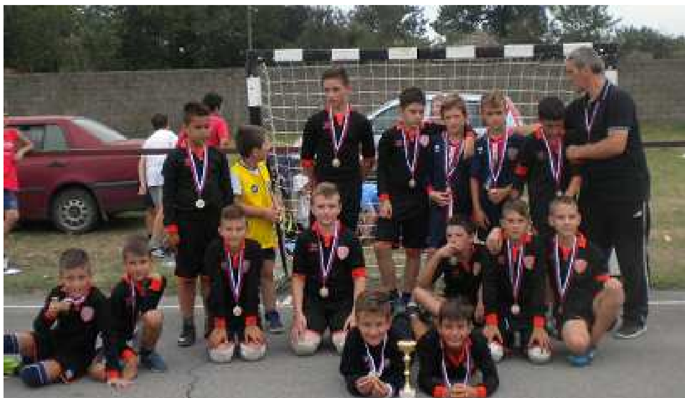
РК УДАРНИК 1 из ЛОЗОВИКА ДРУГОПЛАСИРАНА ЕКИПА код ДЕЧАКА